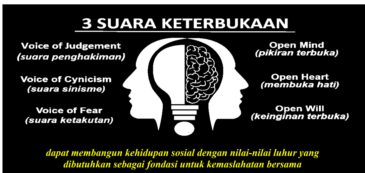
Gambar 2. tiga Suara Keterbukaan Dalam Internalisasi Nilai Moderasi Beragama

Kedua , mempraktikkan analisis 3 (tiga) suara keterbukaan dalam penguatan moderasi beragama dalam kegiatan pembelajaran, yang terdiri dari: open mind (pikiran terbuka); open heart (membuka hati), dan open will (keinginan terbuka), seperti pada gambar berikut.